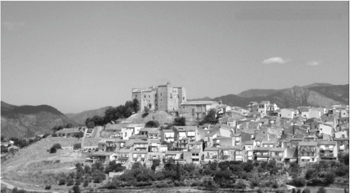
Veduta di Castelbuono.

La caratteristica di Astuta Tv è quella di non essere imbrigliata, come gran parte delle Telestreet, dietro rigide logiche di palinsesto, dietro vincoli di sorta, dietro compiacimenti e pressioni o di vendersi a logiche pubblicitarie o di mercato. Si va avanti con una lentezza sinonimo di qualità e genuinità. La Sicilia non poteva che essere il contesto di questa similitudine, una terra che per secoli è andata avanti lentamente, a volte a retromarcia, sinonimo di frustrazione e passività. Ma Astuta, dicevamo agli inizi, in siciliano vuol dire “spegni”, ecco quindi il principale obiettivo: far sì che la gente giunga a spegnere la Tv e a realizzarne concretamente una. È un utopia e/o un efficace slogan, per quanto apparentemente contraddittorio? Il tentativo di Astuta Tv vuole andare in questa direzione,