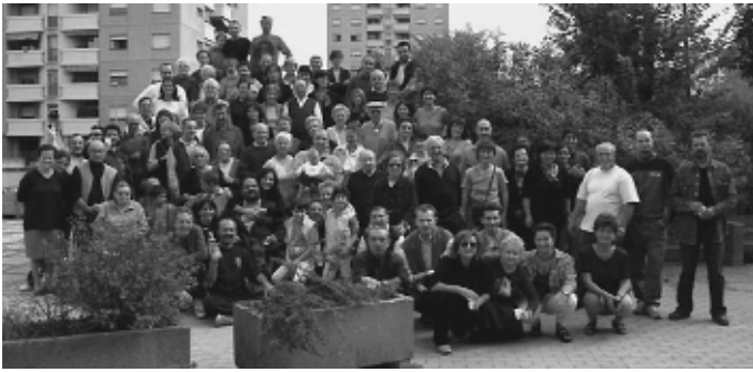
Foto di gruppo dei condomini durante la festa dei 25 anni di Torre 19.