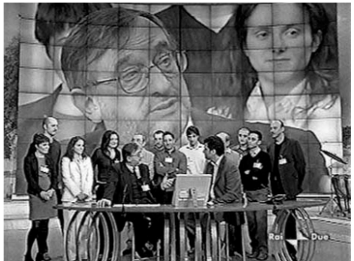
Una delle apparizioni di TeleTorre19 sulla Tv nazionale: la partecipazione alla puntata del 13 aprile 2004 di Piazza Grande su Rai 2.

Proprio per questo l'attività che fin dall'inizio maggiormente ha attratto è stata la realizzazione del notiziario. Ogni set-