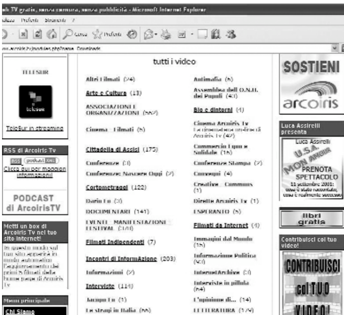
L'indice delle categorie di Arcoiris Tv.

di Arcoiris.tv su altri siti). I filmati sono poi offerti in vari formati, non ultimi dvd, xvid e video podcast (ma anche solo l'audio in mp3).