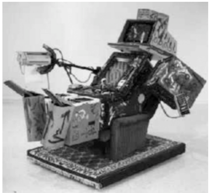
Orfeo Tv, festival Rotterdam 2006.

È soprattutto per questo motivo che pensiamo di integrare le lezioni con interventi esterni di coloro i quali trovano nelle nuove possibilità tecnologiche della produzione di audiovisivi un buon motivo per parlare di come esse influiscano sull'evoluzione dei vecchi linguaggi o delle nuove ripercussioni giuridiche e politiche che esse comportano. È sempre per lo stesso motivo che i corsi formativi non saranno propedeutici all'inizio del lavoro redazionale, ma procederanno di pari passo con esso permettendo non solo di mettere in pratica le conoscenze via via acquisite, ma di proporre, in sede di corso, le problematiche riscontrate e manifestare fin da subito alcune propensioni personali all'uso dei mezzi a disposizione o alla formulazione dei messaggi.