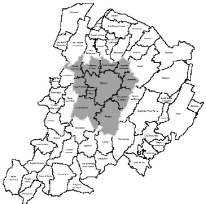
Bologna. Area Metropolitana. Città di Città